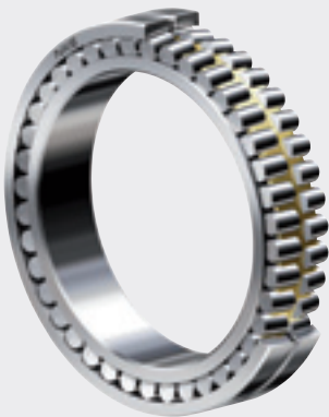
Сферический роликовый подшипник NKE