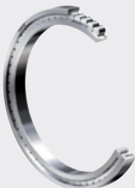
Безсепараторный цилиндрический роликоподшипник NKE ,полностью готовый к эксплуатации