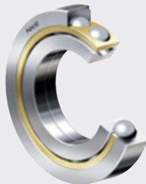
Шариковый подшипник с четырёхточечным контактом