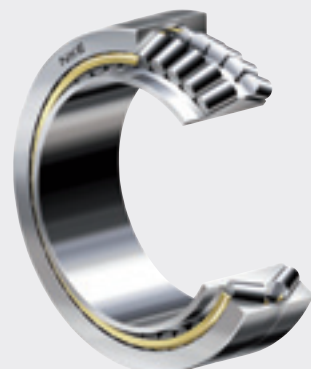
Конический роликоподшипник NKE