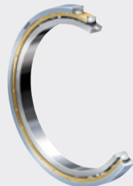
Однорядный радиальный шарикоподшипник (с электроизолирующим покрытием на наружном кольце)